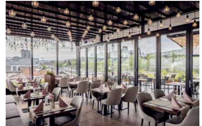
Multifunktional: Lichthöfe, Restaurant, Tiefgarage, Büroflächen, Fitnesscenter, Lidl-Filiale und ca. 100 Business-Appartements.

Zunächst haben wir den gesamten Bestand (die voll vermooste Rohbau ruine) mit unserem 3D-Scan erfasst und ein komplett neues Projekt mit mehr Nutzfläche entwickelt. 80% der Grundstücksfläche sind Untergeschossfläche, die mit einer festen Rühlwand-Baugrubensicherung und auf einer Pfahlfundation gebaut war und nicht mehr zurückgebaut werden konnte. Auf dieser Grundlage und mit nur ein paar unstimigen Plänen fing alles an. Mehr Details? Sprechen Sie uns gerne an. Wir freuen uns über Ihr Interesse.