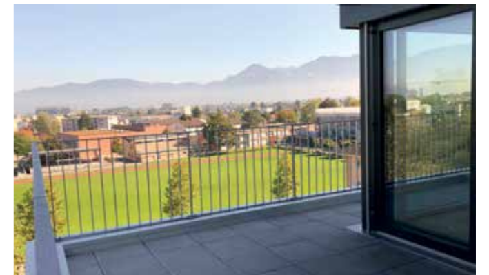
Zur Auflockerung der verdichteten Bauweise sind transparente, gedeckte Veranden eingesetzt worden und im obersten Stock Terrassen mit diesem herrlichen Ausblick bis nach Österreich.

Im Sinne der Nachhaltigkeit sind die Gebäude in Sichtbeton umgesetzt. Ihr moderner Baustil, die durchdachten und funktionellen Grundrisse mit leicht zu möblierenden Raumstrukturen und der hochwertige Innenausbau mit Eichenparkettböden und geschmackvoll ausgestatteten Bädern heben sich vom üblichen Standard ab – all dies setzt höchste Massstäbe.