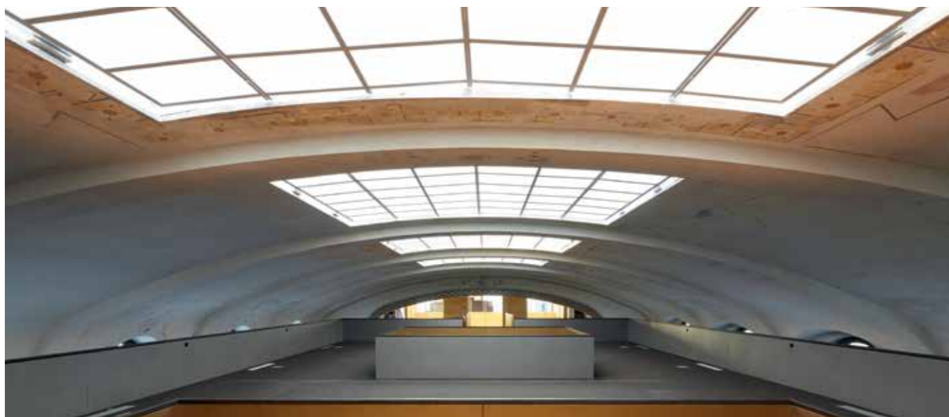
Eine neue Nutzung ist wie ein neues Leben. Die geschichtsträchtige Stadthalle ist heute der Sitz der Organisation «Schweiz Tourismus».