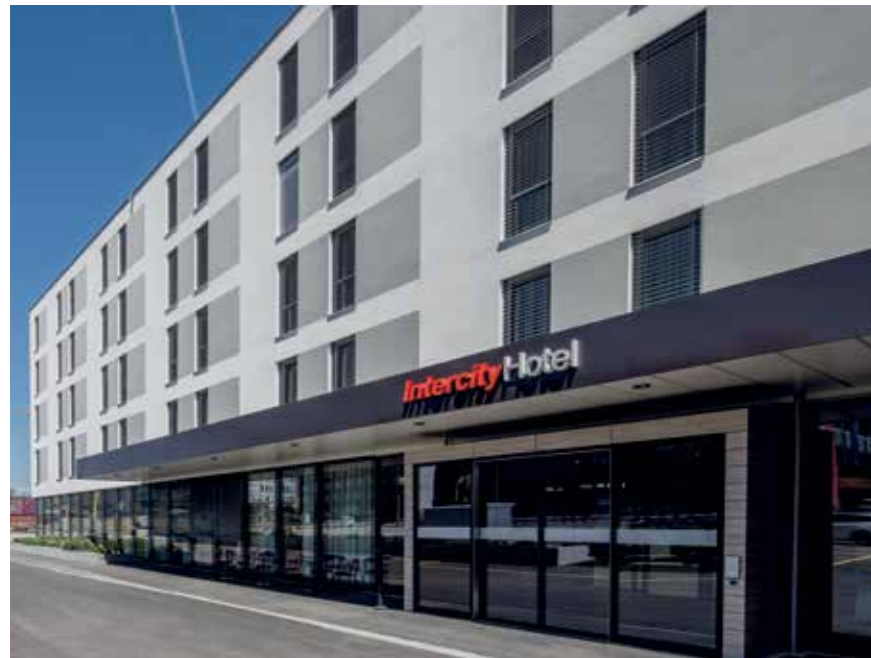
METHABAU-Meisterleistung: anspruchsvoller Innenausbau, aufwendige Haustechnik-Installationen und Vollüberwachung aller Schaltungen und Messungen mit Visualisierung jedes Zimmers.

LEISTUNGEN: Volle Projektverantwortung als Totalunternehmer ab Übernahme Rohbau-Bauwerk, inklusive kompletter Neuplanung aller Gewerke, inklusive Projektentwicklung und Optimierung, Baugesuch und Bewilligungsverfahren, komplette BIM-Ausführungsplanung sowie alle METHABAU-Bauleistungen wie Baumeister-, Metallbau- und Schlosserarbeiten.