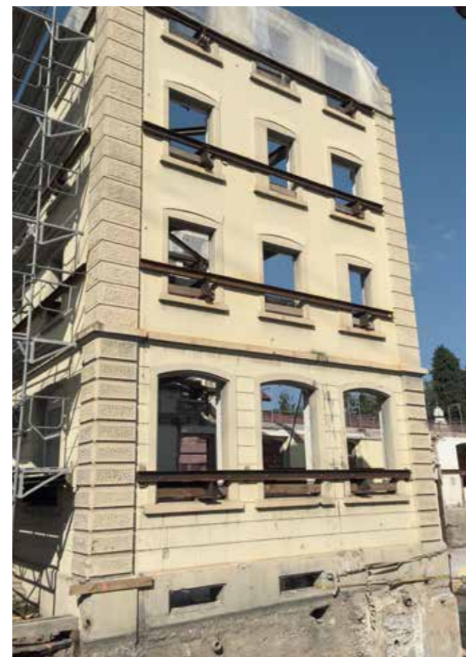
Aus Alt mach Neu.