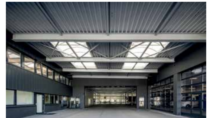
Innovativ: Statt Geschoss für Geschoss von unten nach oben zu bauen, haben wir drei Geschosse von hinten nach vorne realisiert.

Eine anspruchsvolle Aufgabe, die wir im Schichtbetrieb lösen und damit auch die aufwendige Bauinfrastruktur optimal nutzen konnten. Unser Plan ging auf: Wir haben mit der Idee, von hinten nach vorne zu bauen (durch eine speziell optimierte Kranlogistik), ein sehr innovatives Konzept umgesetzt. Mit einer Art Hochparterrelösung für die Erschliessung der Buseinstellhalle auf zwei Geschossen, mit einer statischen Dicke der Decke über dem EG von 80 cm und mit einem Parkdeck für 200 PKWs auf dem Dach (der Baugrund liess keine Tiefgarage zu). Viele weitere Hürden haben wir mit Bravour gemeistert. Und am Ende stand das Gebäude pünktlich bereit: eine grossartige Bauleistung.