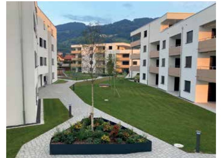
Grosszügige Aussenanlage, ebenso viel Spielraum für individuelle Möblierungen bieten die durchdachten, funktionellen Grundrisse.

Volle Projektverantwortung als Totalunternehmer inklusive Projektentwicklung & Optimierung, Baugesuch und Bewilligungsverfahren sowie teilweise Unterstützung der Baumeisterarbeiten durch METHABAU. Volle Verantwortung als Bauherrin, Investorin, Leitung Baumanagement und Vermarktung der Miet- und Eigentumswohnungen, Käuferbetreuung, Stockwerkeigentümer und Investment, Immobilienbewirtschaftung sowie gezielte Inhouse-Bauleistungen.