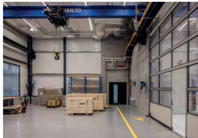
Kompetenz auf allen Ebenen: von der Grundidee für das Gebäude bis zur PV-Anlage.

Auch technisch ist das Gebäude insgesamt sehr anspruchsvoll bestückt. Vor allem klimatisch, aber auch durch die Luftreinigung, das KNX-Hausleitsystem, die Zugangskontrollen-Badge-Anlage, die Videoüberwachung und nicht zuletzt durch den Röntgenbunker mit Spezialhülle – Kompetenz durch und durch.