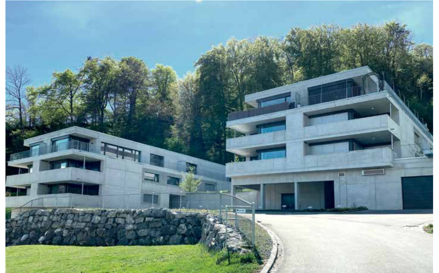
Im Grünen wohnen. Modern und zur Miete.

Was ein hoher Wohnungsstandard bedeutet, sieht man am Neubau der drei Mehrfamilienhäuser.