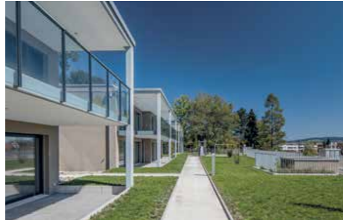
Schöne Visitenkarte: einladend Wohnen in Minergie-zertifizierten Terrassenhäusern.

Herausforderungen gab es genug: die sehr schmale Baustellenzufahrt, die grossen Spezial-Tiefbauaufwendungen (die massive Hanglage verlangte über die ganze Überbauungsrückwand, bergseitig, eine wuchtige, bis 10 m hohe Rühlwand-Baugrubensicherung). Und in der Tiefgarage wurden die beiden Geschosse untereinander durch eine Kreisellrampe erschlossen. Das Ergebnis kann sich sehen lassen.