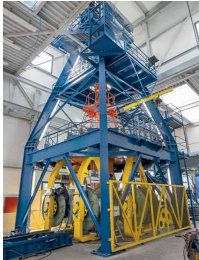
Superschwergewicht: Produktionshallen mit Einzellasten bis 200 t, Recktunnel im UG bis 800 t, Portalkran bis 150 t, Nutzlast OG bis 1'200 kg/m 2

Volle Projektverantwortung als Totalunternehmer inklusive Projektentwicklung, Gestaltungsplanung, Baugesuch und Bewilligungsverfahren, komplette BIM-Ausführungsplanung sowie alle METHABAU-Bauleistungen wie Baumeister-, Metallbau- und Schlosserarbeiten.