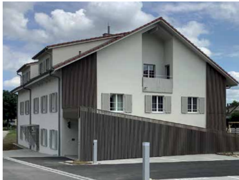
Äusserlich passt sich der Neubau dem ländlichen Ortsbild von Pfyn an. Hinter den (Holz)-Fassaden ist das Innenleben hochmodern.